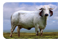
JQR Amostra - Irmã Materna